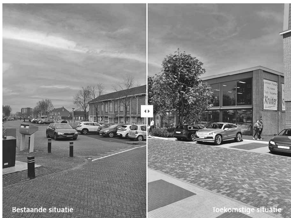
Locatie 1: Parkeerplaats Steenwijkerdiep, kijkend richting toekomstig gebouw Aldi

In de Steenwijker Courant van 27 maart stond een uitgebreid artikel met bijbehorende foto's, waarin het onderwerp mooi wordt belicht.