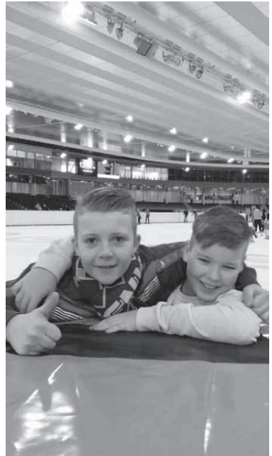
Schaatsen deel 2