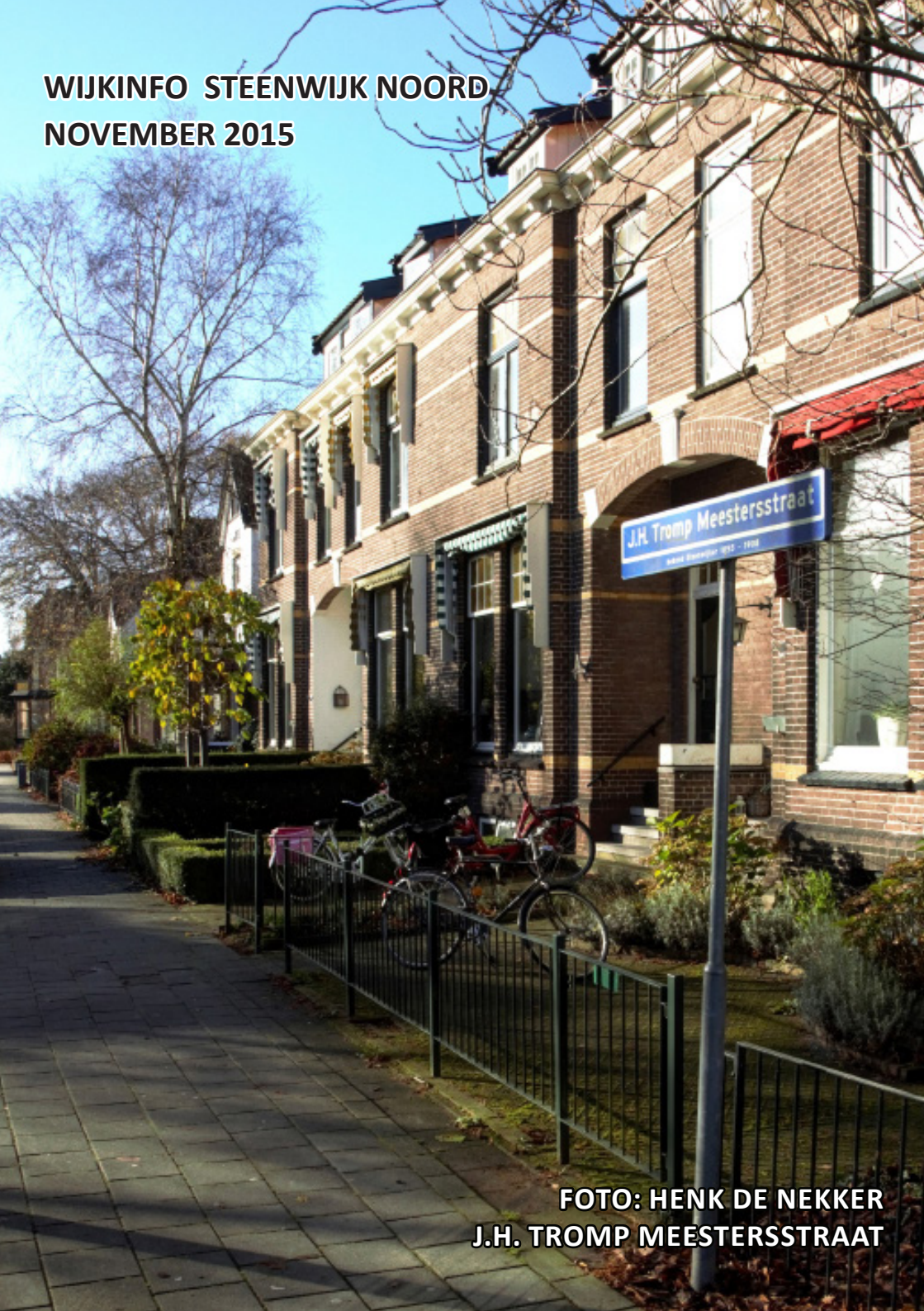
J.H. TROMP MEESTERSSTRAAT