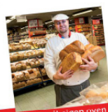
vers uit eigen oven