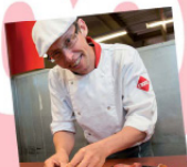
de specialist in barbecuen