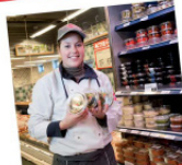
vleeswaren en olijven