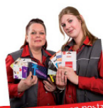
cadeaukaarten en postzaken