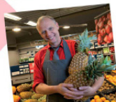
vers van onze groentefdeling