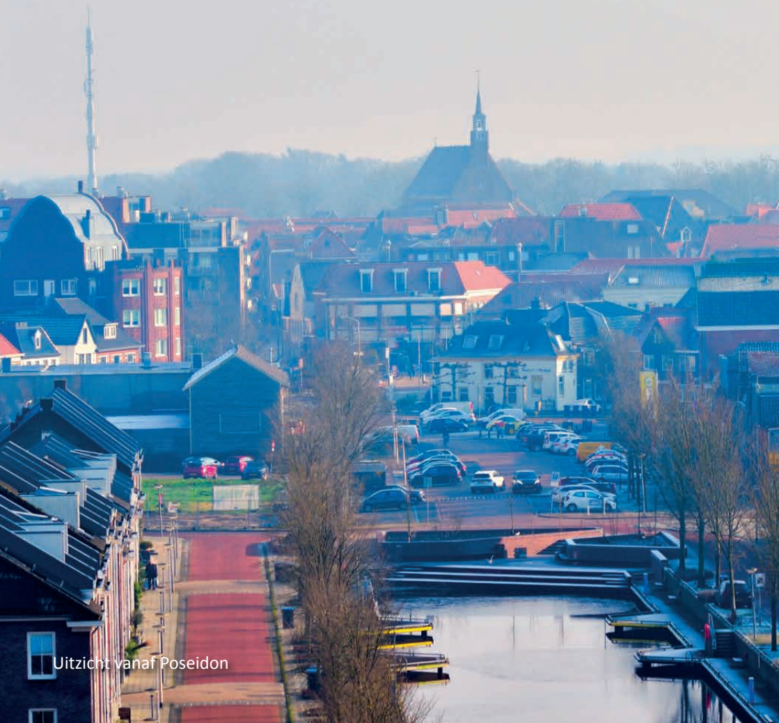
Uitzicht vanaf Poseidon